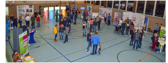
Etwa 20 regionale Firmen und weiterführende Schulen sind auf der jährlich stattfindenden Ausbildungsplatzbörse vertreten.