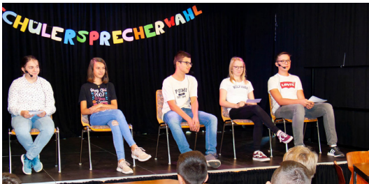
Mitwirkung durch demokratisch gewählte Schülersprecher - die Kandidaten stellen sich den Fragen ihrer Mitschüler